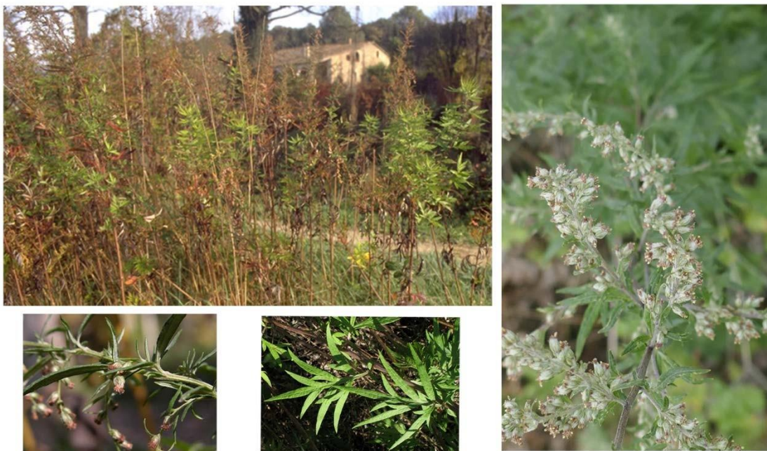
Fig. 1. Visió general d'un marge de camí amb artemísies en flor i visió de detall d'algunes branques florides (inflorescències en capítol i fulles) i de fulles.

Es troba a vores de camins i carreteres, vores de rius, terrenys no cultivats i pobres, fins i tot a sòls salins i de la terra baixa a l'alta muntanya.