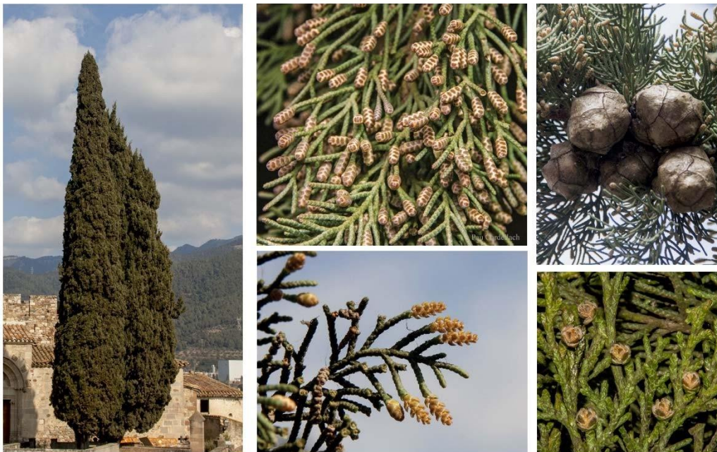
Fig. 1. Visió general d'un paisatge urbà amb xiprers i visions de detall de (al mig) branques acabades amb inflorescències masculines i (a la dreta a dalt) de gàbuls (fruits) i (dreta a baix) branques acabades en inflorescències femenines

Es troben plantats a places, parcs i jardins i són habituals a cementiris i fent tanques de camins i barreres per protegir els cultius del vent a l'entorn rural.